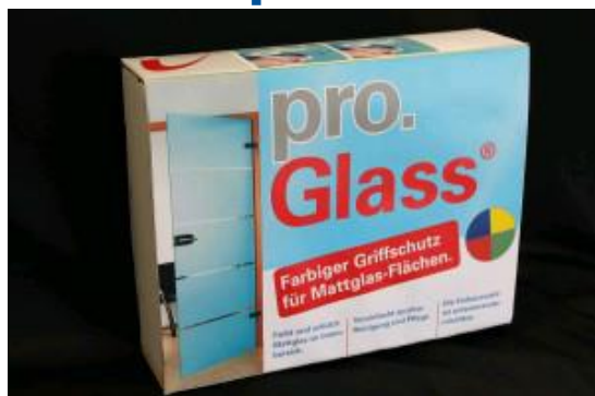
pro.Glass® Color Professional Box