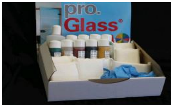
pro.Glass® Color Professional Box